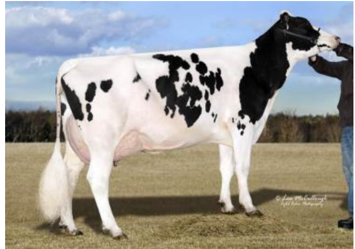
5th Dam: Vision-Gen Sh Frd A12276-ET EX-90

MGGS: Mr Rubicon Dynasty-ET TL TV TD MGGD: Farnear Abby Delt 31523-ET